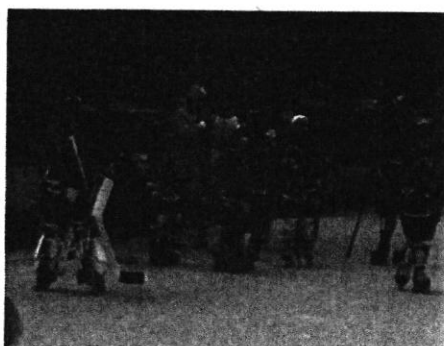
Slika 11. Tema: Hokej, Internet

Element koji povezuje sve sudionike HOD-a je bijela majica. Naime, to je boja koja na simboličan način predstavlja prijateljstvo među ljudima, kao što to čini „zastava prijateljstva“, tj. olimpijska zastava bijele boje s pet isprepletenih krugova.